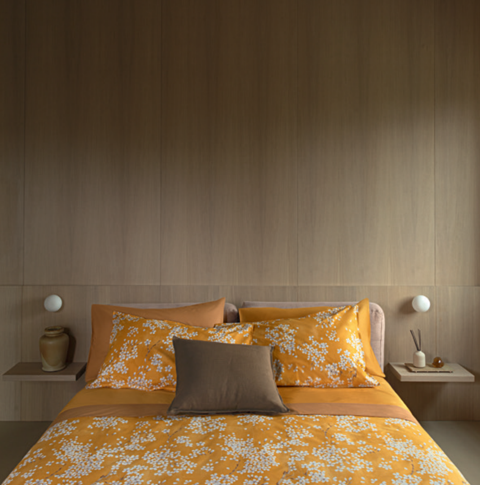
Completo lenzuola Dialogo; parure copripiumino Kimono; cuscino Soffio. Dialogo bedlinen set; Kimono duvet cover set; Soffio cushion.