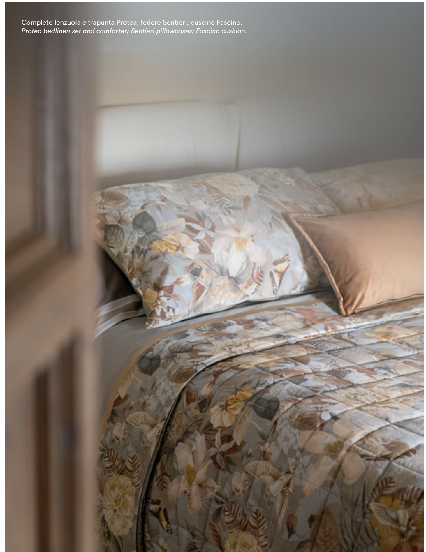
Completo lenzuola e trapunta Protea; federe Sentieri; cuscino Fascino. Protea bedlinen set and comforter; Sentieri pillowcases; Fascino cushion.