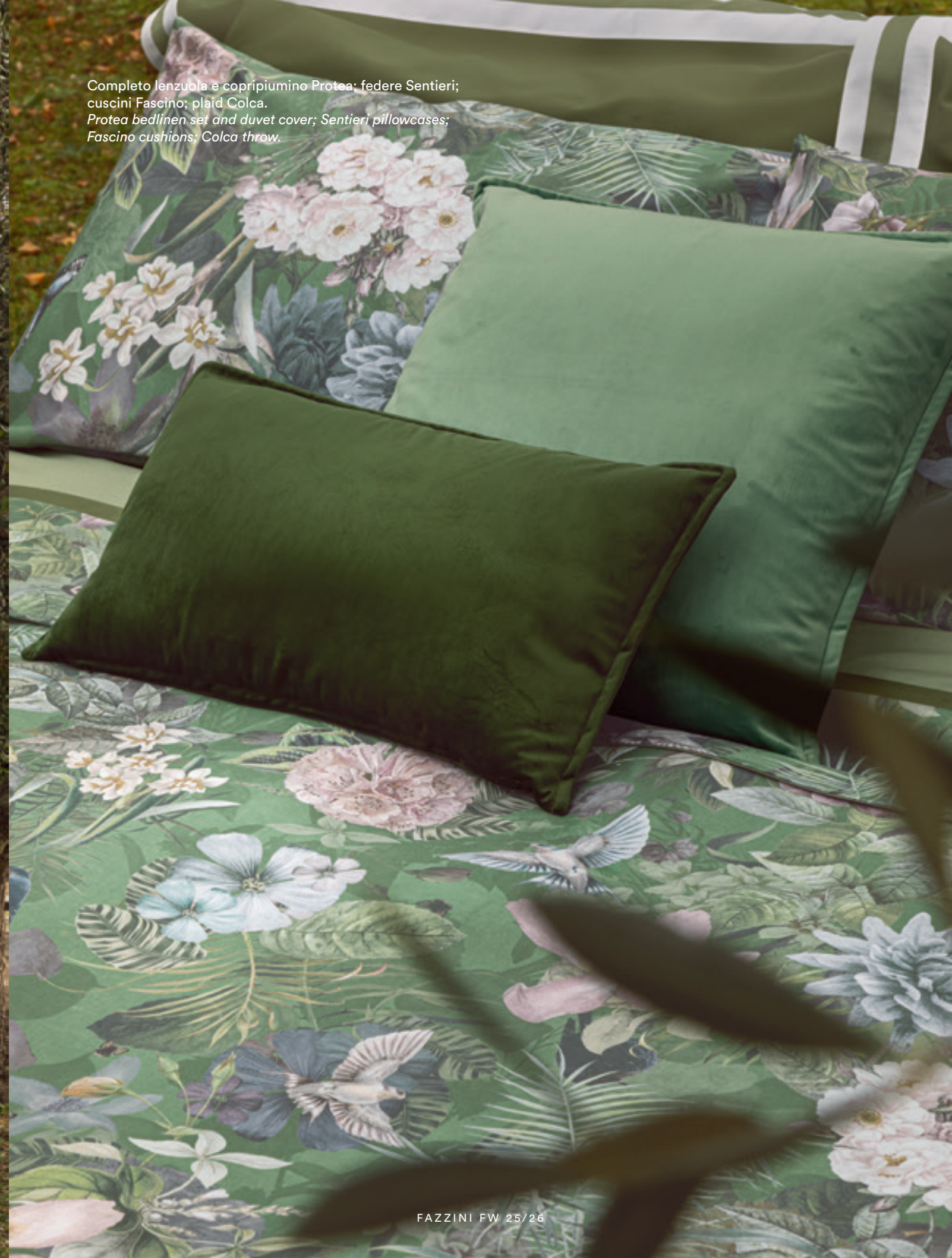
Completo lenzuola e copripiumino Protea; federe Sentieri; cuscini Fascino; plaid Colca. Protea bedlinen set and duvet cover; Sentieri pillowcases; Fascino cushions; Colca throw.