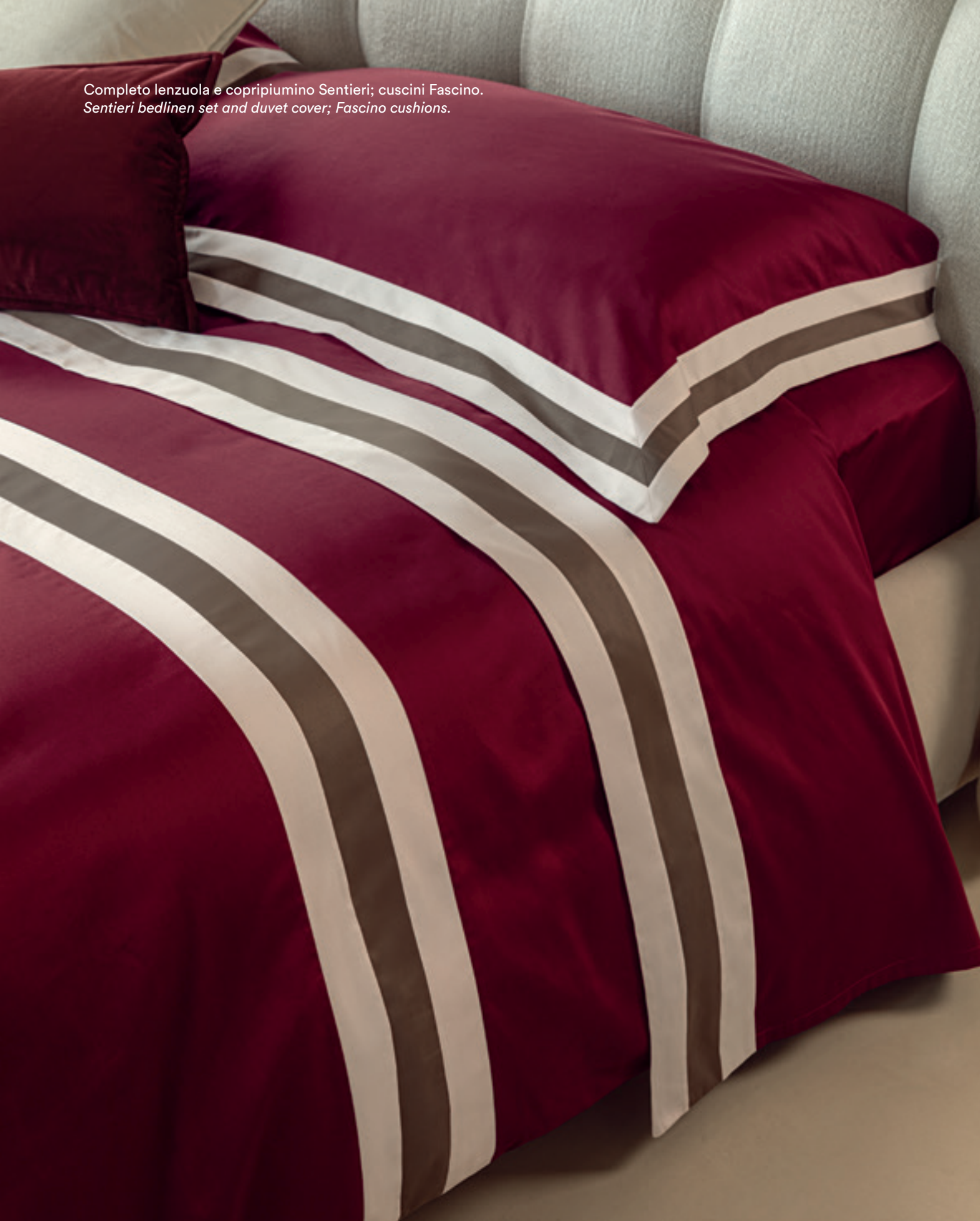
Completo lenzuola e copripiumino Sentieri; cuscini Fascino. Sentieri bedlinen set and duvet cover; Fascino cushions.