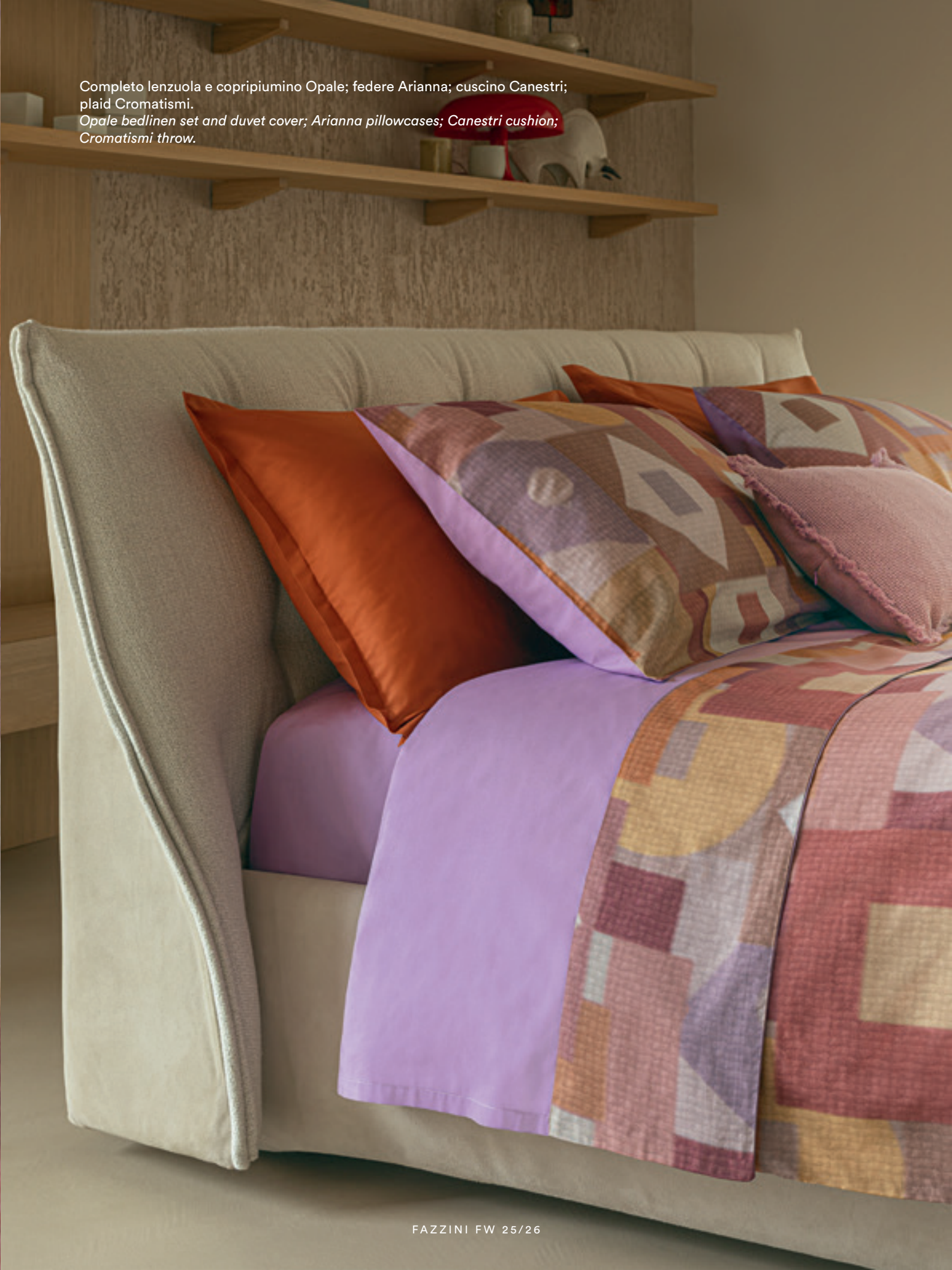
Completo lenzuola e copripiumino Opale; federe Arianna; cuscino Canestri; plaid Cromatismi. Opale bedlinen set and duvet cover; Arianna pillowcases; Canestri cushion; Cromatismi throw.