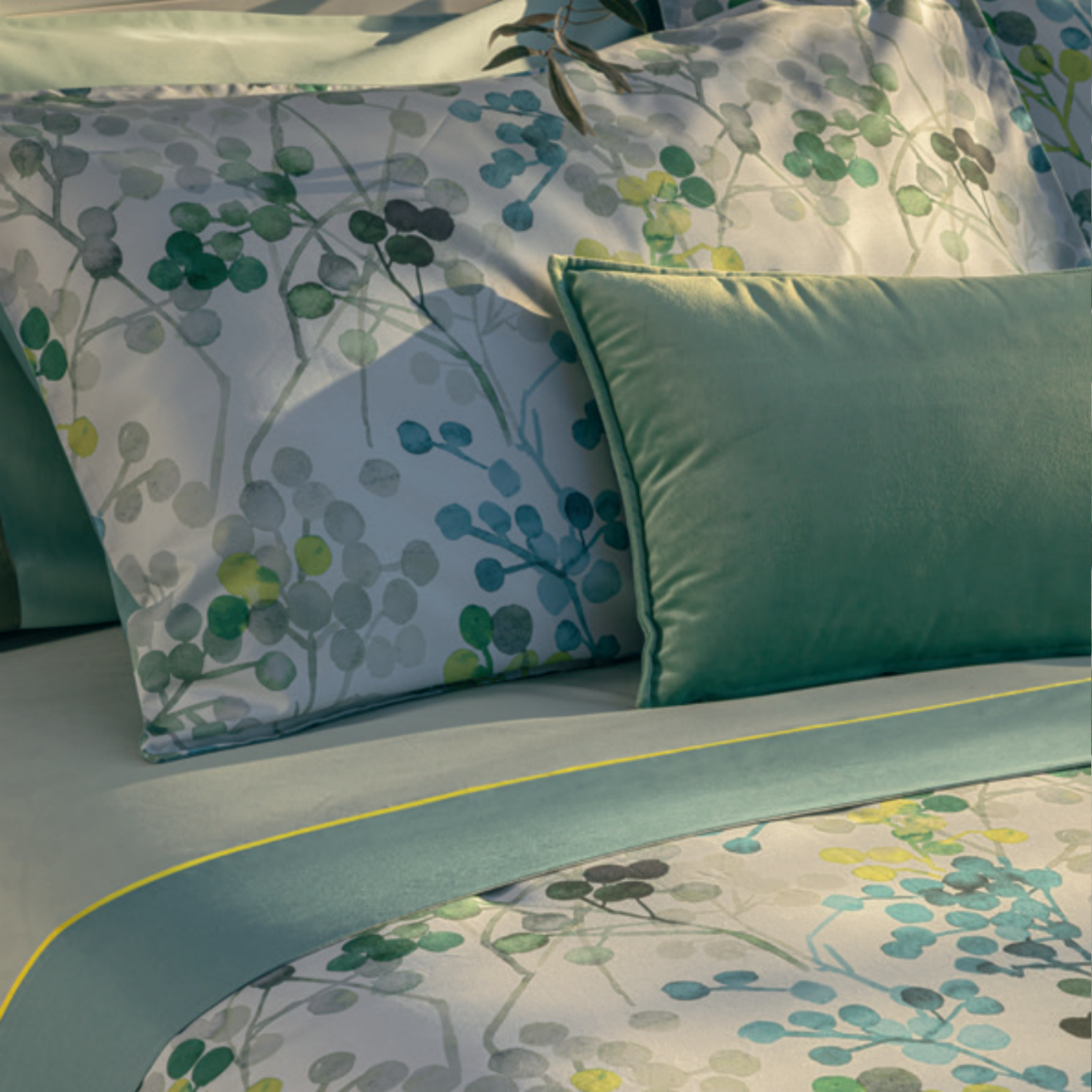
Completo lenzuola e copripiumino Bacche; federe Kubric60; cuscino Fascino; plaid Cromatismi. Bacche bedlinen set and duvet cover; Kubric60 pillowcases; Fascino cushion; Cromatismi throw.