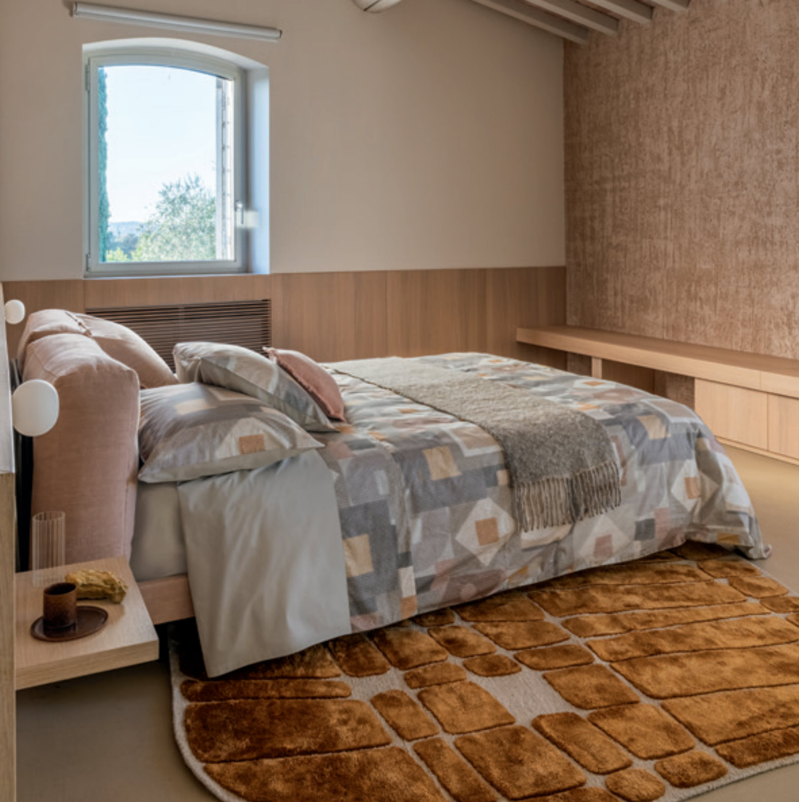
Completo lenzuola e copripiumino Opale; federa Arianna; cuscino Canestri; plaid Cromatismi. Opale bedlinen set and duvet cover; Arianna pillowcase; Canestri cushion; Cromatismi throw.